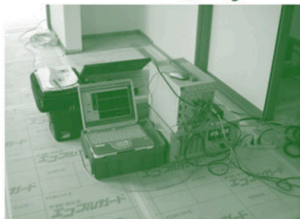
コンピュータで解析します。