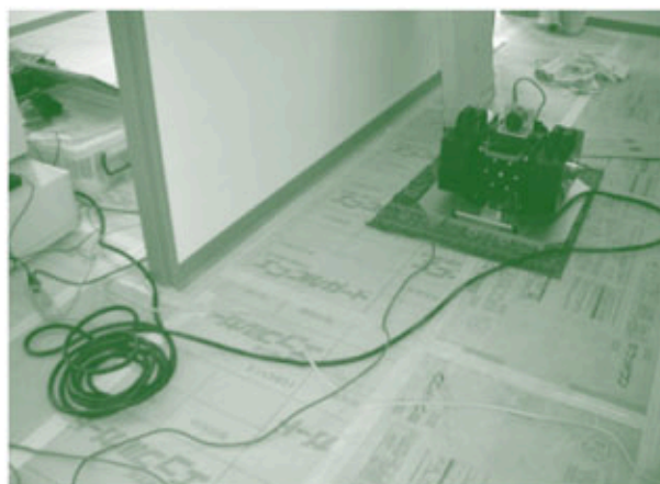
床に起震機を設置し測定します。